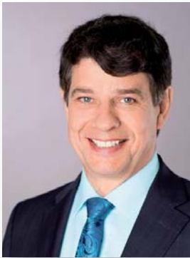
Klaus Schumacher Bürgermeister

Ihr Baby ist da! Herzlichen Glückwunsch. Wir wünschen Ihnen, dass die Freude, dieses kleine Wesen tatsächlich in den Armen halten zu können mit jedem Tag wächst.