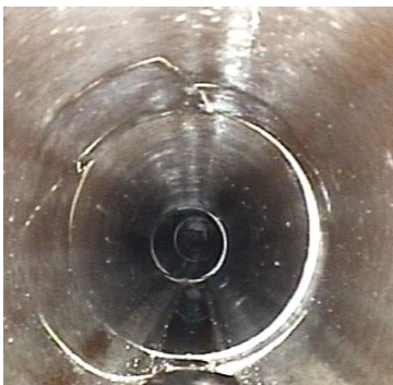
z. B. Rissbildung

Der Kanal in der Fährstraße weist im Bereich der Häuser 7 bis 11a starke Schäden auf, die kurzfristig saniert werden müssen.